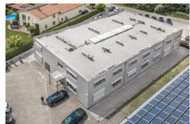
Entwicklung, Projektierung und Vertrieb