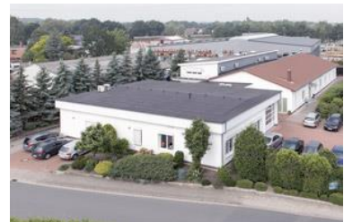
Einkauf und Fertigung/Lager