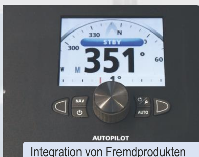
Integration von Fremdprodukten