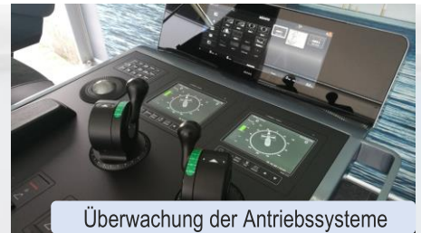
Überwachung der Antriebssysteme

Weiterhin zeigen wir eine neuartige Videobildumschaltung mit der Möglichkeit der gleichzeitigen Anzeige von vier Systemen auf einem Monitor (Split-Screen).