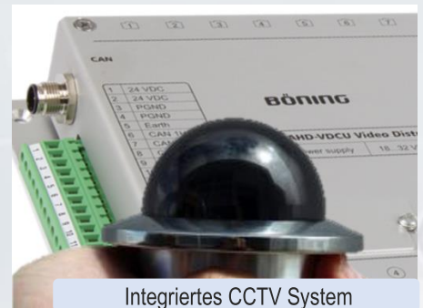
Integriertes CCTV System

Wir haben unser Produktspektrum erweitert und bieten neue, kompakte Marinekameras zum Anschluss an unsere bewährte Video-Matrix AHD-VDCU. Diese liefern hohe Bildqualität bei erheblich geringeren Verzögerungszeiten des Videobildes.