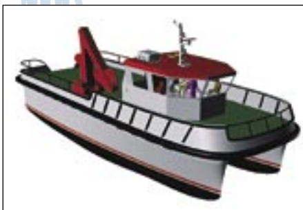
Rendering del catamarano per Livorno. La consegna è prevista a inizio 2011

Interessante commessa acquisita dal costruttore di Anghi in provincia di Salerno: si tratta di un catamarano in alluminio destinato al Gruppo Ormezzatori di Livorno che verrà utilizzato anche per il trasporto merci non deperibili, con una capacità di carico fino a 30 tonnellate. Agromare, che ha recentemente realizzato 3 classici battelli per ormeggio - che abbiamo presentato nella rivista di Novembre 2009 - apre quindi un nuovo mercato sicuramente interessante date le caratteristiche offerte dallo scafo a catamarano che garantisce grande stabilità e capacità di carico con buone prestazioni anche con ridotte motorizzazioni. Sulla base di questo ordine alla Agromare si è sviluppato il progetto tenendo in considerazione altre possibili applicazioni come battellaggio, servizi ecologici e lavoro in generale, sia in ambito portuale che off-shore con range di navigazione fino alle 20 miglia e con velocità massime dell'ordine dei 14-15 nodi. La progettazione della carena a tal fine è stata molto accurata e testata nella vasca navale del Dipartimento di Ingegneria Navale dell'Università di Napoli. Le caratteristiche tec-